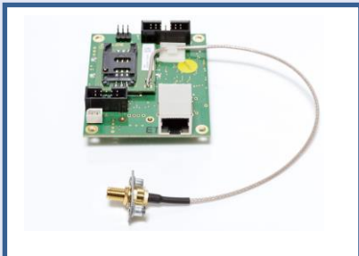
Web server – Web server + GSM